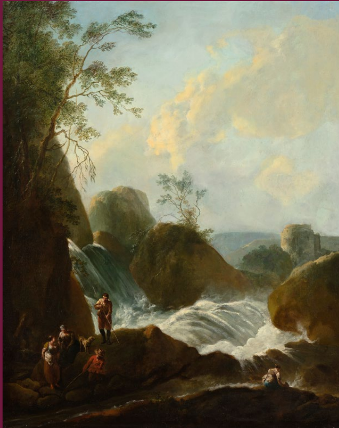
'Rotslandschap met waterval', maker onbekend, ca. 1700, olie op doek, 116 × 98,7 cm. Inventarisnummer: NK1835