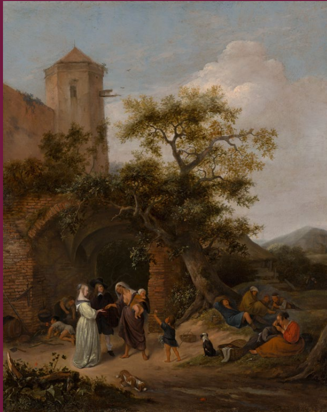
'De Waarzegster', Jan Steen, 1650-1654, olie op doek, 73,5 × 60 cm. Inventarisnummer: NK2727