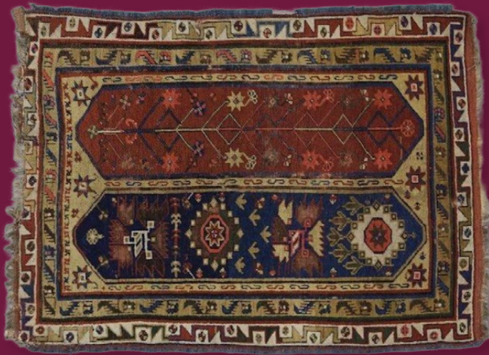
Megri-tapijt, maker onbekend (Turkije), 1800-1824, wol, geknoopt, 185-127 cm. Inventarisnummer: NK1047