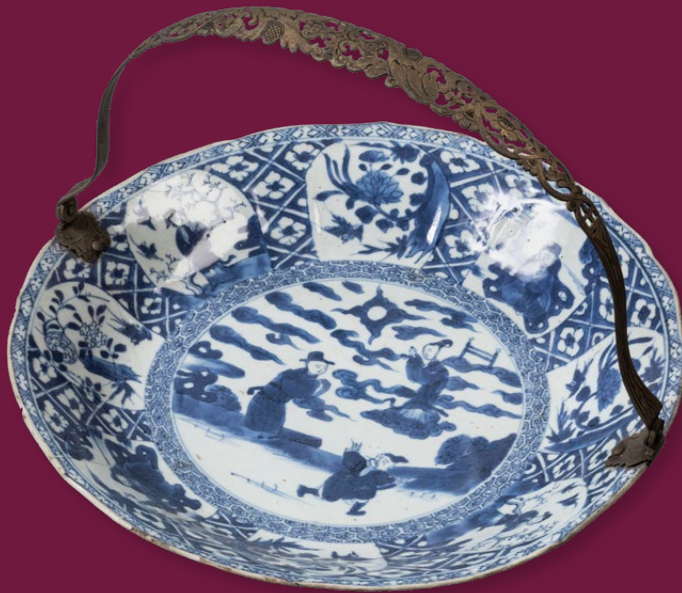
Bord met zilveren hengsel, maker onbekend, 1800-1899, porselein en zilver, 27 cm. Inventarisnummer NK-collectie: NK292