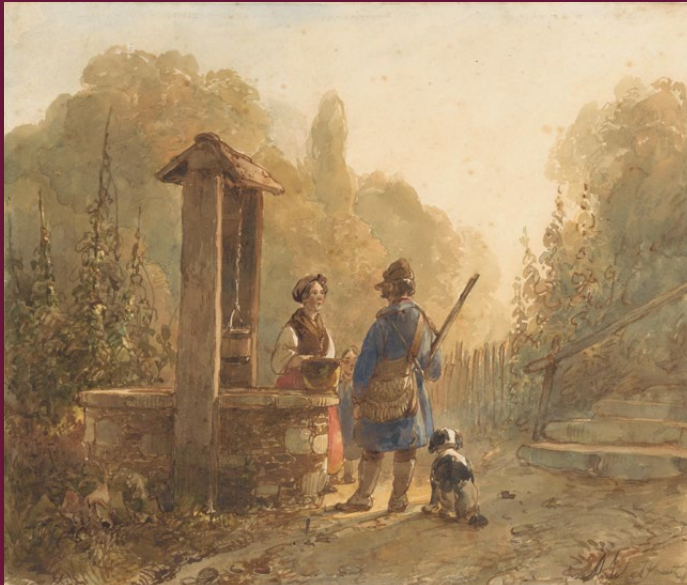
'Jager bij een waterput', Andreas Schelfhout, 1800-1870, aquarel op papier, 19,3 × 22,5 cm. Inventarisnummer NK-collectie: NK3098