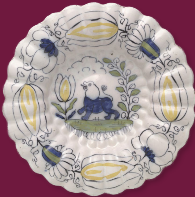
Ploischotel, maker onbekend, 1700-1749, aardewerk, glazuur, 35 cm. Inventarisnummer: NK325-A en -B