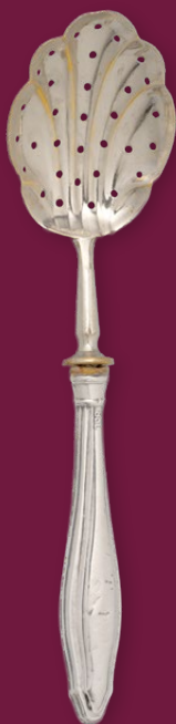
Strooilepel, maker onbekend, verzilverd metaal, 1900-1929, 14,8 cm. Inventarisnummer: NK3591